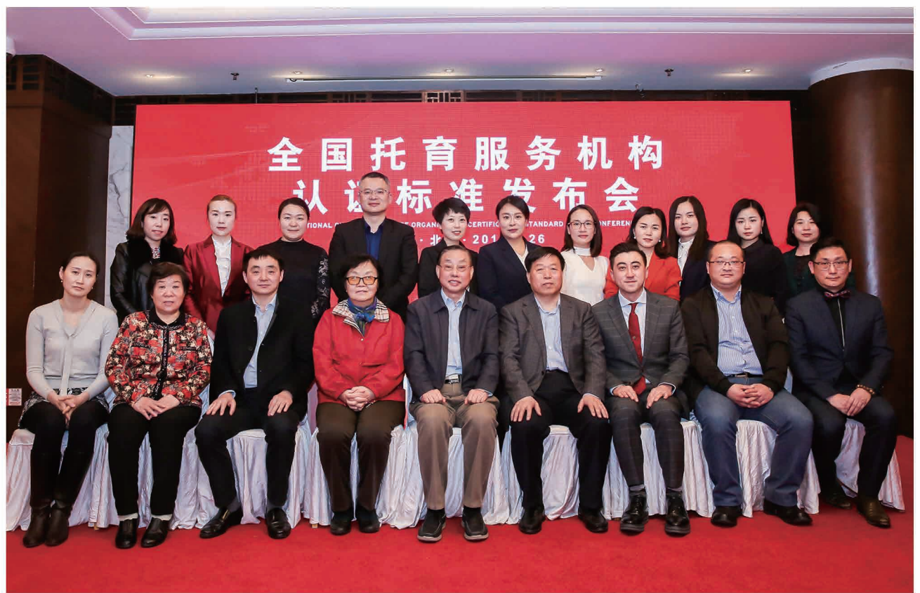
标准先行 · 普惠托育